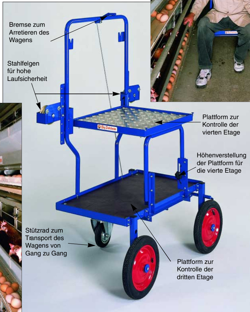
Inspektionswagen für Käfiganlagen mit bis zu vier Etagen