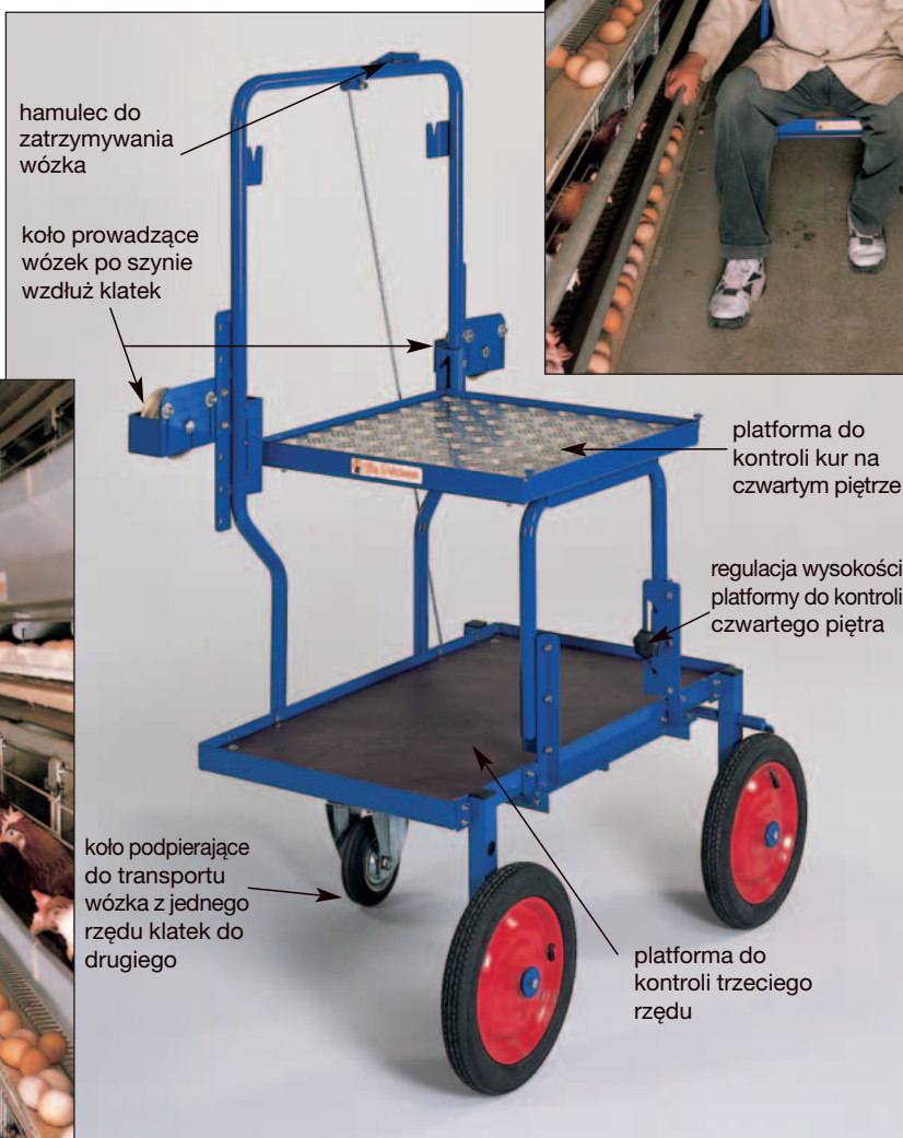
Wózek kontrolny do klatek do czterech pięter