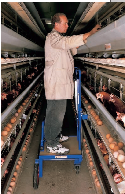
Контрольная тележка для клеточной батареи до четырёх этажей

Согласно требованиям § 3, 3 абзац в сочетании с § 5, 2 абзац, в предписании по содержанию несушек в Нижней Саксонии, при новостройках и перестройках необходим „дополнительный вспомогательный механизм для обеспечения просмотра клеточной батареи, как в нижних, так и в верхних этажах. Данный вспомогательный механизм должен быть устроен так, чтобы из безопасной позиции с помощью обеих рук был возможен выбор больной или пораненной птицы.“